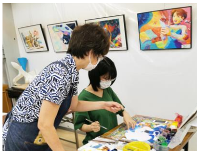
2015年度以前の合格実績は、教室掲示板・ホームページをご覧ください。