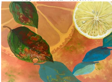
2018年度 京芸 合格 参考作品