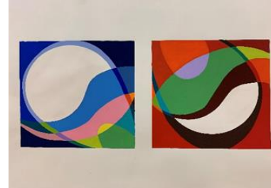
2023年度 京芸入試 再現作品