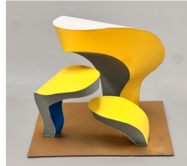
2024年度 京芸入試 再現作品